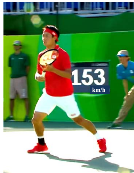
Document 1 :